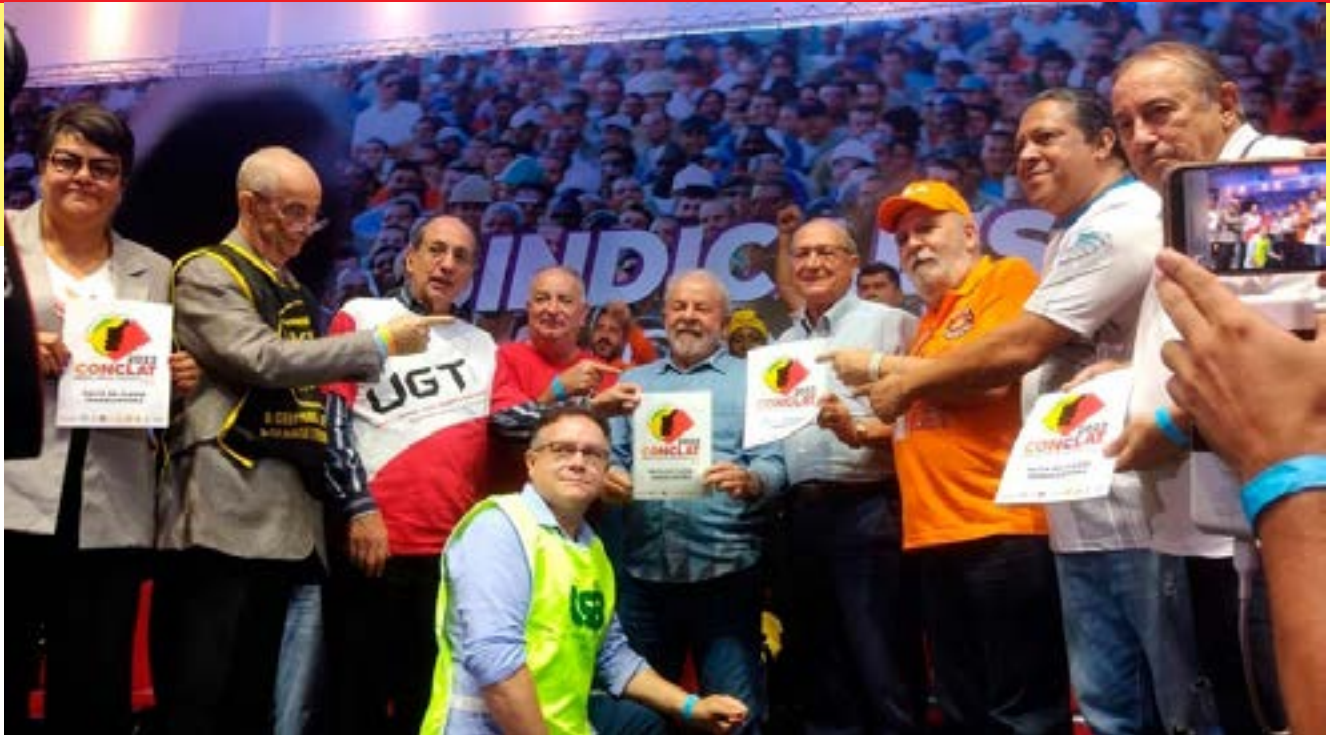
Dirigentes das Centrais entregaram a Pauta da Classe Trabalhadora ao ex-presidente Lula

No dia 14 de abril, na Casa de Portugal, Centro de São Paulo, as Centrais Sindicais realizaram entrega da pauta de reivindicações aos pré-candidatos Lula e Alckmin.